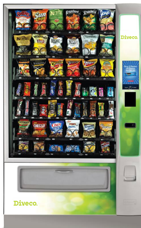
Combo Media 2